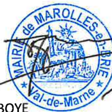
Alphonse BOYE Maire de Marolles-en-Brie

Le présent acte est susceptible d'un recours contentieux devant le Tribunal Administratif dans un délai de deux mois à compter de sa publication et peut être saisi par l'application Télérecours citoyens accessible à partir du site www.telerecours.fr .